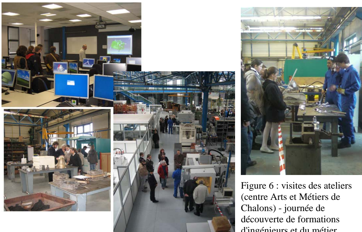
Figure 6 : visites des ateliers (centre Arts et Métiers de Chalons) - journée de découverte de formations d'ingénieurs et du métier d'ingénieur

7) Le lions Club de NANCY STANISLAS DOYEN et l'association "Dessine moi un rêve" se sont alliés pour offrir à trois collégiens méritants de Maxéville, trois semaines dans le centre de vacances des Lions clubs de Kerber – Le Conquet en Bretagne, où les enfants ont pu profiter de :