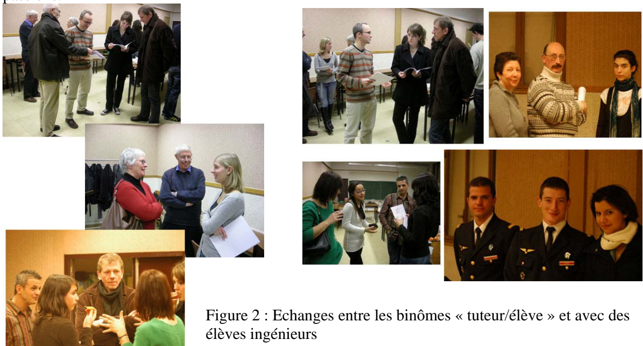
Figure 2 : Echanges entre les binômes « tuteur/élève » et avec des élèves ingénieurs

3) « Dessine-moi un rêve » a présenté ses meilleurs vœux pour l'année 2009 à tous les acteurs du dispositif le jeudi 8 janvier 2009 à 18h à l'École des Mines de Nancy : les 8 élèves tutorés et leurs parents, les tuteurs, les représentants de la mairie de Maxéville, les représentants de l'association, ... Cette soirée a aussi été l'occasion d'une nouvelle rencontre entre les élèves parrainés et les huit élèves ingénieurs de l'école des Mines de Nancy ayant choisi d'effectuer leur projet de première année dans le domaine de l'ouverture sociale sous l'encadrement de « Dessine-moi un rêve » et avec six élèves ingénieurs pilote de l'école de l'air de Salon de Provence qui sont venus témoigner de leurs parcours mais surtout de leurs passions.