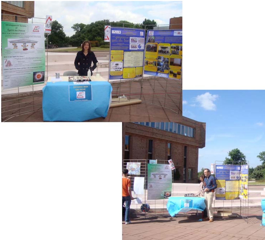
Figure 8 : Stand de Dessine-moi un Rêve à la journée DD de l'INPL

9) A plus de ces actions nous pouvons ajouter la participation le 4 juin 2009 de "Dessine-moi un rêve" à la journée du développement durable de l'INPL - action financée par le CDFI dans le cadres de l'appel d'offre de la semaine du développement durable dans les écoles françaises d'ingénieurs.