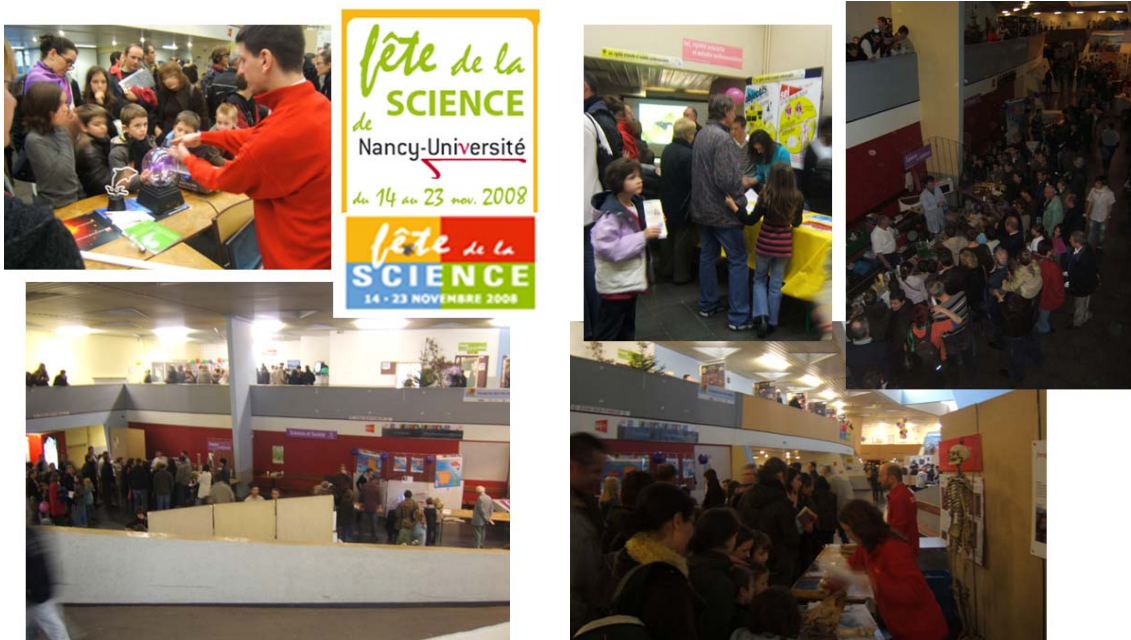
Figure 1 : visite guidée des stands de la fête de la science.

1) Dans le cadre de ce parrainage, l'association a proposé aux élèves parrainés de leur organiser une visite guidée des stands de la fête de la science . Cette visite a eu lieu le samedi 15 novembre 2008 sur le village de la science à la faculté des sciences et a concerné 6 des élèves parrainés accompagnés de leur tuteur et des membres de l'association.